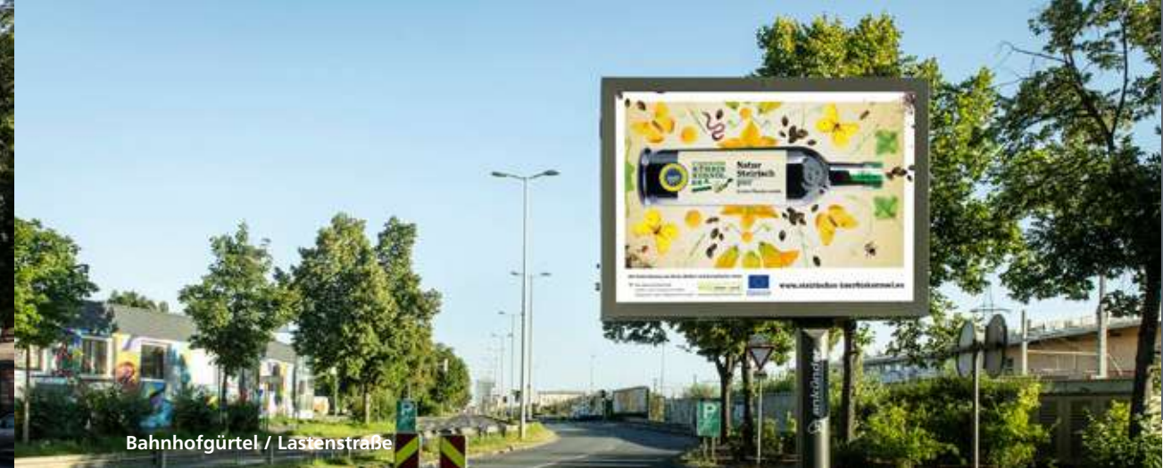
Bahnhofgürtel / Lastenstraße