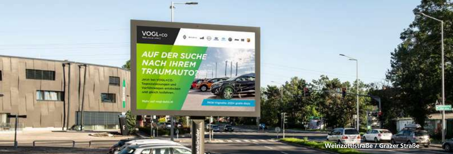
Weinzöttlstraße / Grazer Straße