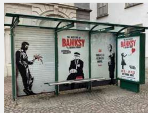
► Totallook Warthaus mit City Light