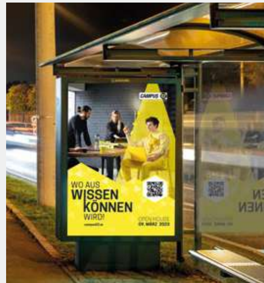
► Warthaus mit City Light