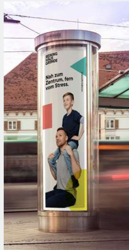
► City Säule

Gerne beraten wir Sie zu den Preisen für City Lights in den steirischen Ballungszentren. An rund 500 Standorten bieten wir in folgenden Städten Werbeflächen an: Bad Aussee, Bruck/Mur, Deutschlandsberg, Gleisdorf, Hartberg, Judenburg, Kapfenberg, Knittelfeld, Leoben, Murau, Mürzzuschlag, Voitsberg, Bärnbach, Köflach, Weiz und Zeltweg.